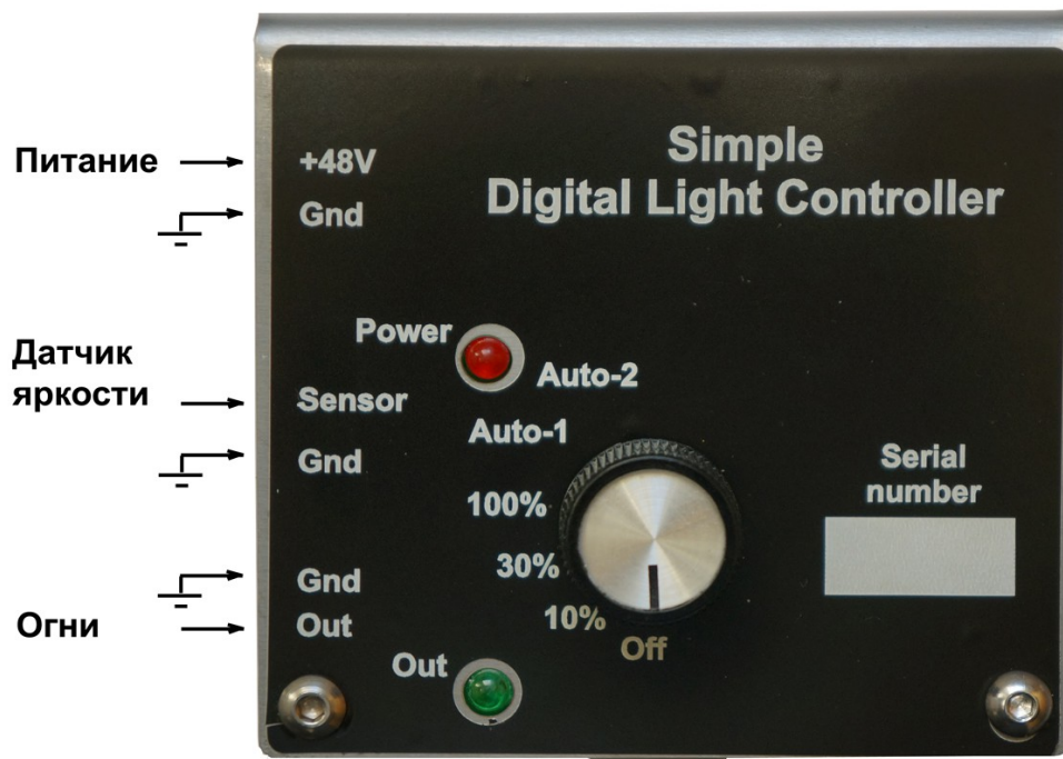
Схема подключения устройства.